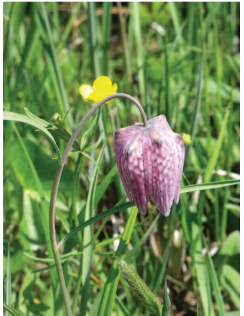
Április első felében lila színbe borul a liliumos rét előterjesztés, indoklás után a helyi tanács kell ez irányú döntést hozzon, ezután a megyei tanácsnak is rá kell bólintania, s természetesen az illető területek tulajdonosainak is.