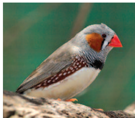
Zebra-pinty (Taeniopygia guttata)

A tájékozott madárkedvelők állítják, hogy dédelgetett, megnyerő szobamadár. Nem igényes sem az elhelyezésre, sem a táplálékra. Eredményesen tenyészthető, sok ezren öt választják. Majdnem egész Ausztráliát lakja, csupán a Kis-Szunda-szigetektől hiányzik. Kedveli a nyílt, füves területeket, ahol néhány fát és bokrot is talál. Fiakat költ a sűrűn települt tengerparti részeken, továbbá a kertekben, parkokban és szántóföldeken is. Társsan költ, rendszerint 10-40 pár csoportosul. Fészket bokrokra, alacsonyabb fákra, épületekre rakja. Máskor a ragadozómadarak fészkeinek aljába vagy az üregi nyúl földlyukaiban neveli fiókáit. Műtán a kicsik kirepültek, csapatokba társulnak, száraz hetek idején nagy távolságokra vándorolnak. Megkeresik a nyílt vízi helyeket, és ott naponta többször fürdenek. Bár kedvelik a vízforrásokat, mégsem szenvednek a vízhiánytól, heketeg bírák a szomjazást. A zebra-pinty több