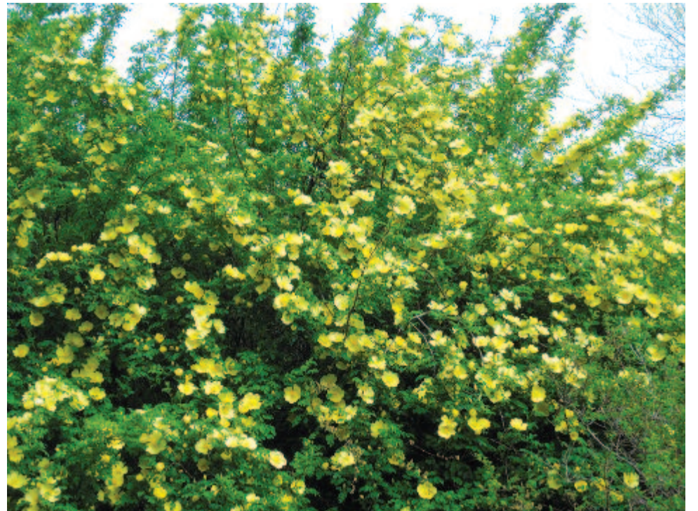
Majális – a nyár ígérete

A méh háziiasítása az I. e. 6-4. évezredben mehetett végbe, és a vadméhek lépeit már az előember is fosztogatta. A méhet nemcsak mézéért, hanem viaszáért is nagyra becsülték. A méhállam szervezettsége, a méhkirálynő