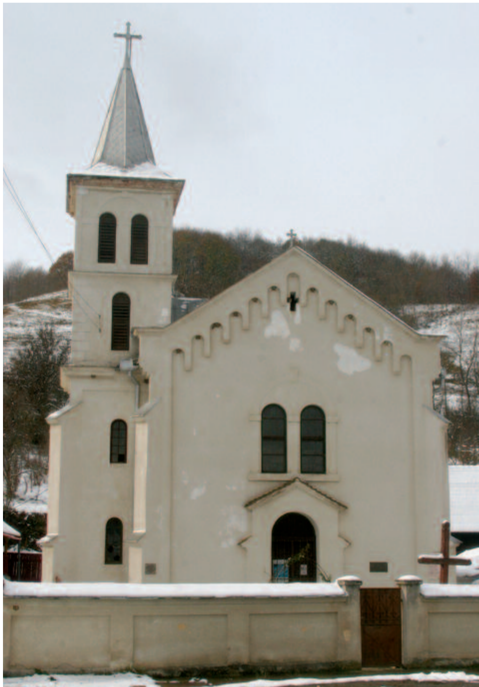
A bolyai római katolikus templom