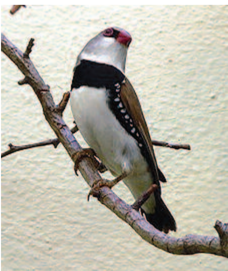
Gyémántpinty (Zanaegithus guttatus)

Kelet- és Dél-Ausztrália száraz erdeiben fészkel. Gyakran megvilan az ottani parkokban és kertekben is. A háta szürkésbarna, a