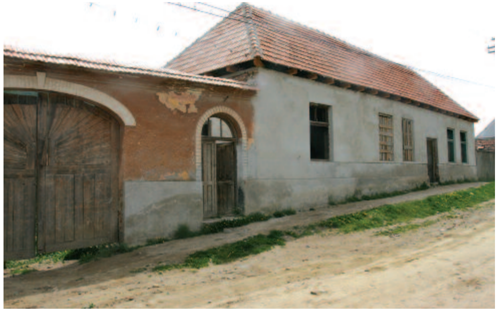
Ennek a háznak a helyén állt a Bolyaiak utolsó lakóháza