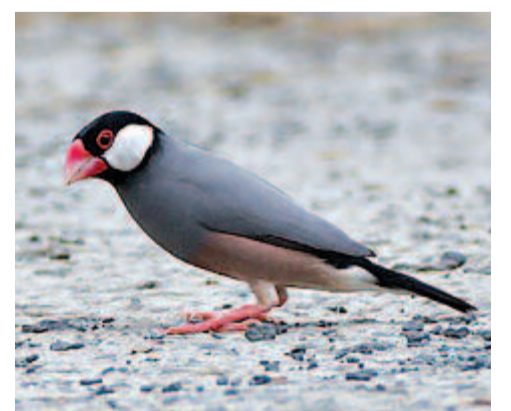
Rizspinty (Padda oryzivara)

Az ókorban és korábban Balin és Jáván éltek nagy számban. Az ember magával hurcolta számos irányba, főként a szomszédos területekre, Délkelet-Ázsiába, a Fidzsi- és Hawaii-szigetekre. Megtalálhatók Tanzánia egyes részein, a Szent Helén-szigeteken is. A rizspinty fejének felső része, szárnyai, farcsíkja és farka fekete, fehér pofáját is fekete vonalak szegélyezik. Tollazata kékeszürke, a hasán rótesek a tollak. A fogságba nehezen nyugszik bele. A kínaiak és japánok mégis évszázadok óta tartják a fehér rizspintyket.