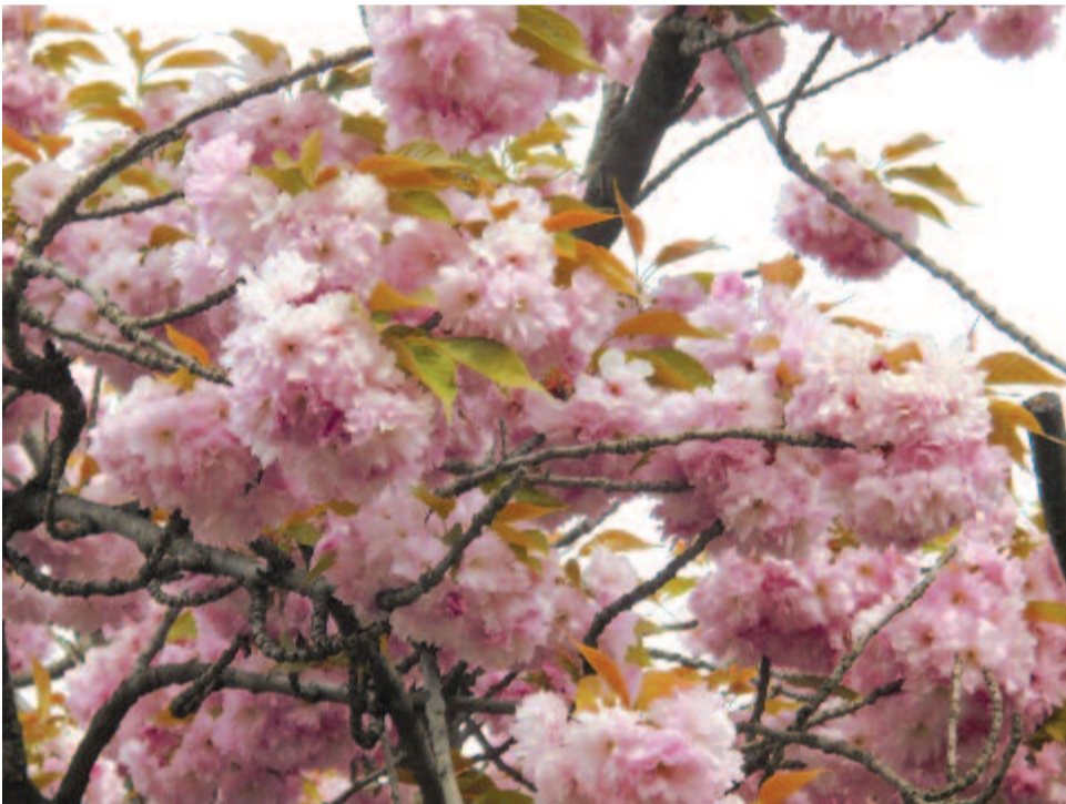
Majális – a tavasz visszatérte

Kelt 2017-ben, a munka ünnepe előtt három nappal.